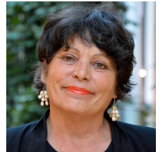
Michèle RIVASI pour EELV