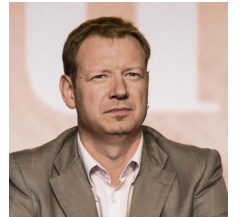
Pierre DHAREVILLE pour le PCF